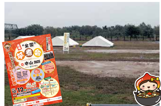
●中止となった芋煮会会場（商工会の会員の集いも中止）