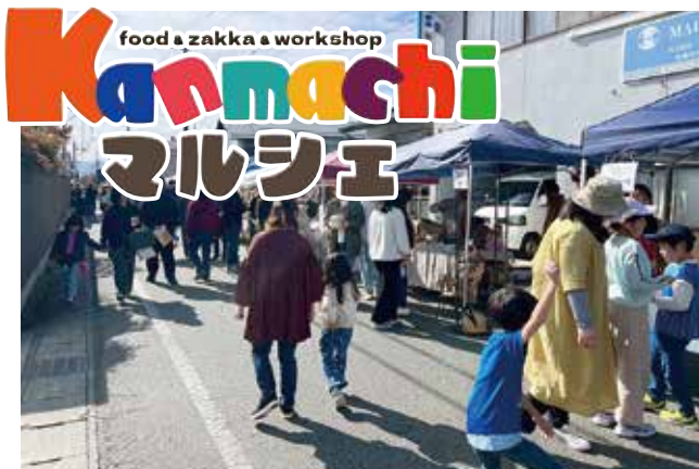
●家族連れでにぎわい、若い世代の活気があふれる