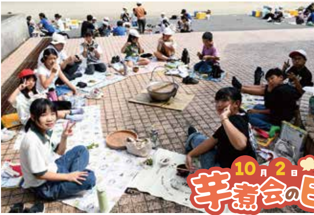
●10月2日の「芋煮会の日」に町内の小学校で芋煮会が行われた。 美味しい芋煮に大満足（豊田小学校）