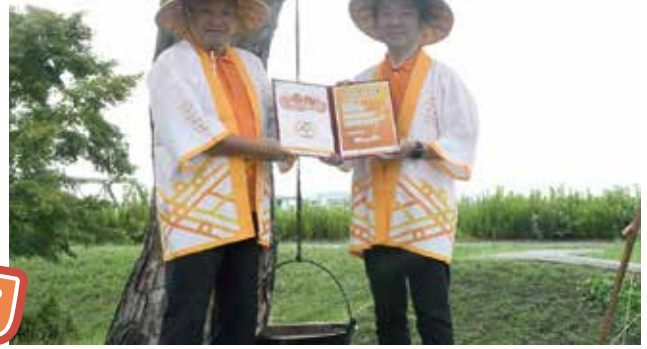
●「芋煮会発祥の地」中山町が、「芋煮会」を気持ちよく屋外で出来ると判断し、 9月5日に全国初の【芋煮会開き宣言】を行った。